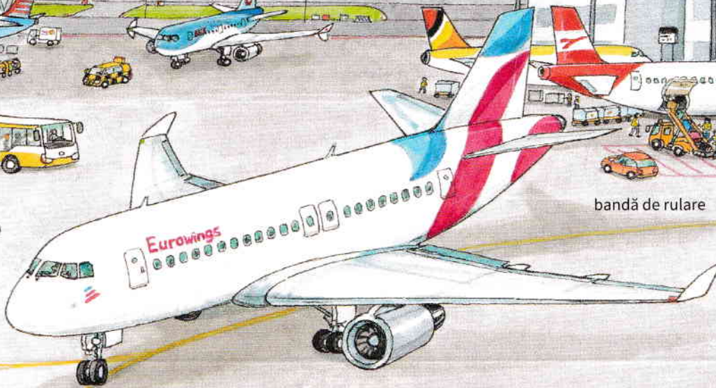
platformă de staționare

Poziția de parcare este fie indicată pe panouri electronice, fie de controlorul cu dirijarea circulației pe suprafața de îm- barcare-debarcare.